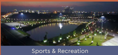
Sports & Recreation